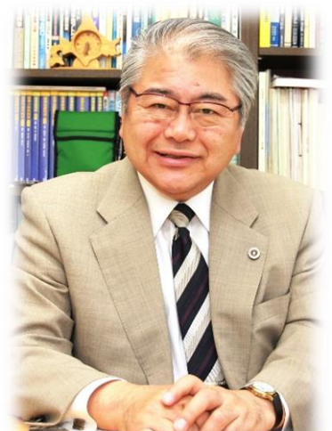
うえだ ふみお 上田 文雄

チェルノブイリ原発事故被災地の医療支援活動に参加し、現地を7回訪問。その後、信州大学医学部第二外科助教授を退官し、ボランティアでベラルーシに単身滞在。5年半にわたり、甲状腺ガンにかかった子どもたちの治療にあたった。帰国後、長野県衛生部長を経て2004年3月より4期16年にわたり松本市長を歴任。2020年10月より松本大学学長に就任し、現在に至る。