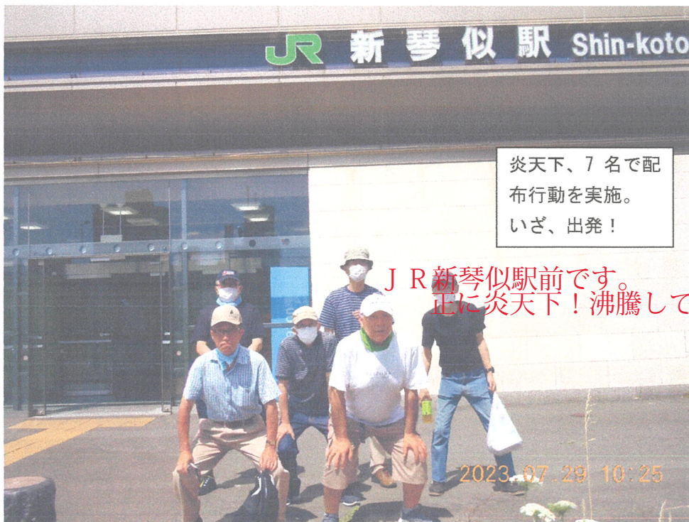
次頁に配布したチラシを掲載

31日の昼休み集会にもうひと踏ん張りします。組合員の皆さん積極的参加をお願いします。（7・29HP）