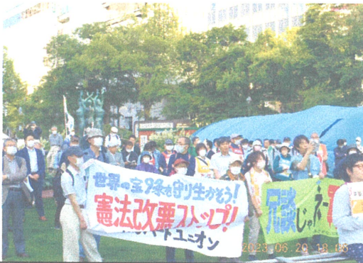
パートユニオン組合員も横断幕を掲げて参加

岸田政権は昨年12月に安保3文書を改訂し、敵基地攻撃能力の保有やGDP1%枠に抑えてきた防衛予算の倍増などを閣議決定しました。2023年度から5年間の防衛費総額を43兆円とする方針を固め、27年度にはGDP2%に引き上げようとしています。現在、防衛費の財源確保に向けた特別措置法案が衆議院を通過しましたが、軍拡競争につながる軍事費増大を許してはなりません。(平和運動フォーラムHP)