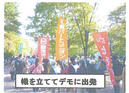
幟を立ててデモに出発