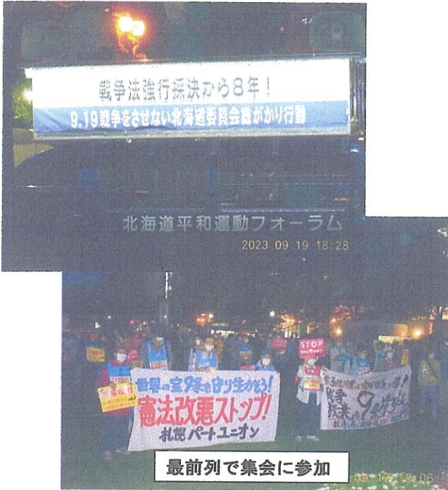
最前列で集会に参加