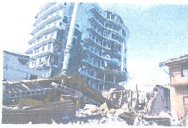
ウクライナとガザ 現地取材から問う日本と世界の平和