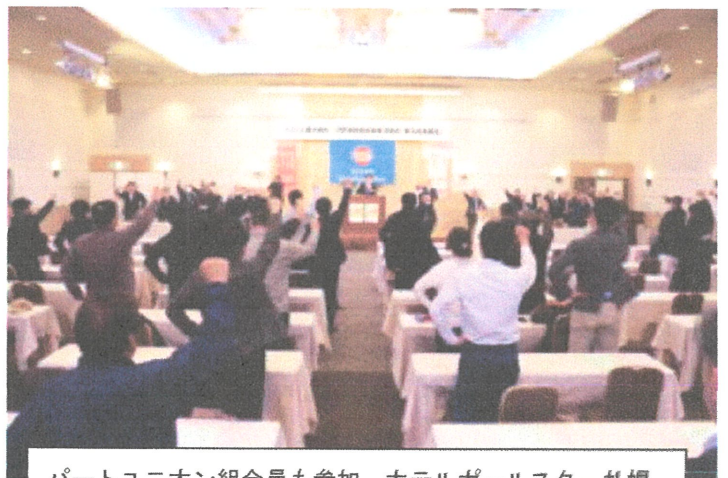
パートユニオン組合員も参加 ホテルポールスター札幌