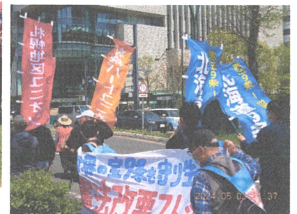
最前列で集会に参加