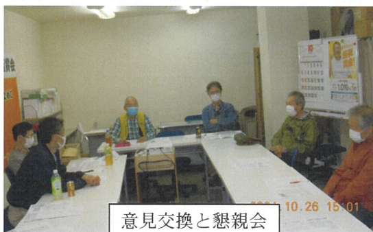
意見交換と懇親会 10.26 15:01

担当の幹事から、新聞記事の資料により9月以降の情勢の進展が紹介され、その後、参加者の感想と意見の交流を行いました。