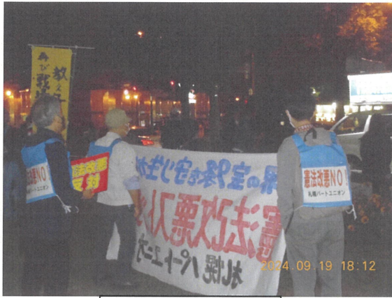
最前列で集会に参加